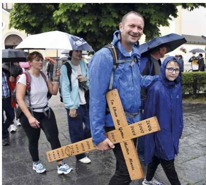
Fußwallfahrt Winzer, 7. Juni 2025