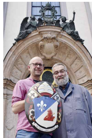
Neues Papstwappen für die Basilika St. Anna, 30. Mai 2025