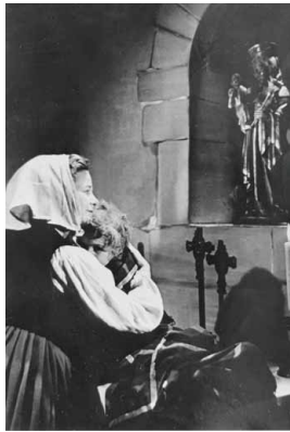
Die bedeutendste Szene: Voll Dankbarkeit hält die Mutter das wieder zum Leben erweckte Kind vor dem Gnadenbild.

auf den Altar gelegt und der Überlieferung nach durch die Fürbitte der Muttergottes wieder zum Leben erweckt wird. Die Außenaufnahmen entstanden u.a. an der Alz bei Hirten (ca. 10 km südlich), da der ursprüngliche Ort des Geschehens, der Mörnbach in Altötting, als Drehort nicht mehr geeignet war. Für die Innenaufnahmen wurde das Oktogon der Gnadenkapelle im Kreuzgang der Stiftskirche originalgetreu nachgebaut. Vom 6. bis 12. März 1950 verwandelte sich Altötting in eine Filmstadt. Großen Anteil am Erfolg hatte auch die eigens durch Uttlinger komponierte Filmmusik. Er dirigierte die Münchner Philharmoniker höchstselbst. Neben bekannten Schauspielern der damaligen Zeit (u.a. Franziska Kinz, Fritz Reiff und Georg Vogelsang) wirkten im Übrigen viele Laiendarsteller aus