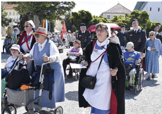
53. Malteser Wallfahrt, 20. Juli 2025