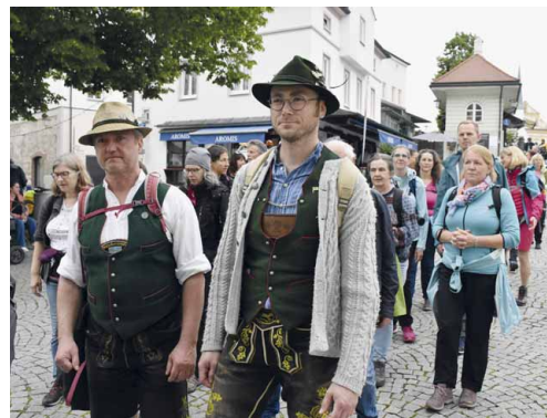
78. Fußwallfahrt Erding, 7. Juni 2025