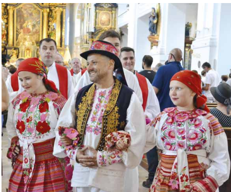
52. Wallfahrt der kroatisch-katholischen Gemeinde in Bayern, 29. Juni 2025