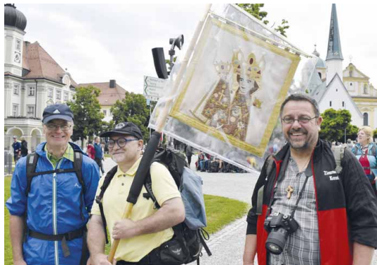
190. Riedenburger Fußwallfahrt, 7. Juni 2025